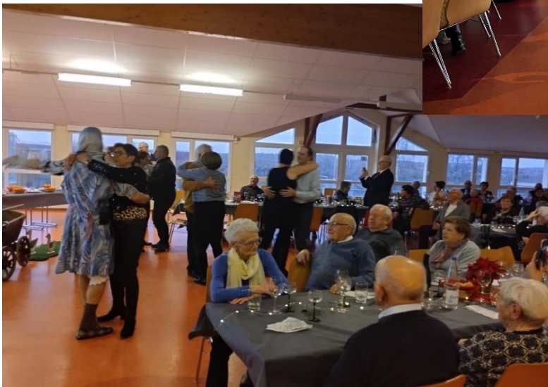
Première participation de la classe 1958