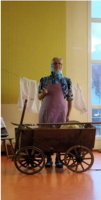
La « Andeknellere »